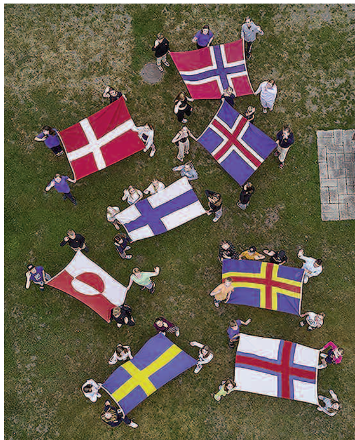
De nordiske flag bliver her vist af deltagere på Nordisk Sommerlejr på DanHostel Hillerød i uge 26 i år.