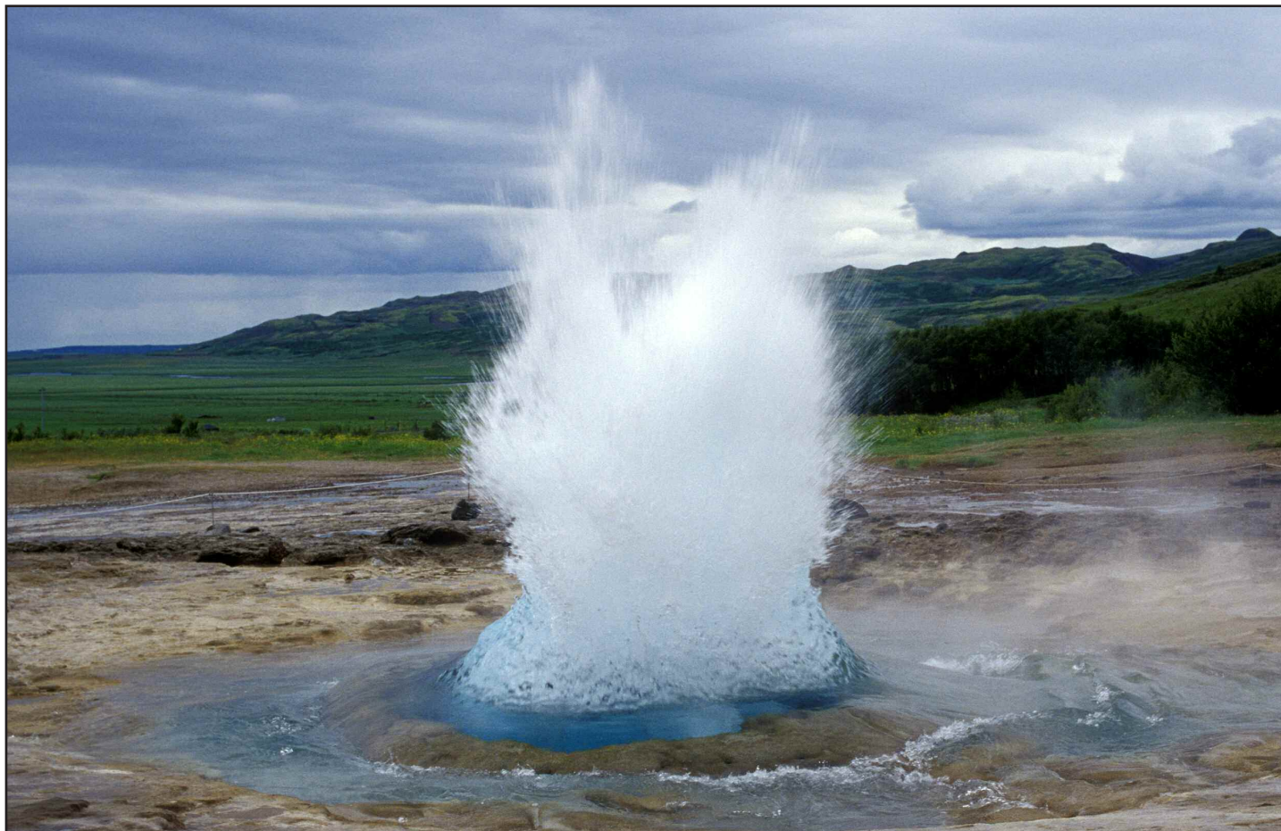
Strokkur - en af de flotte geysere, der vidner om, at Island er selvforsynende med varme fra undergrunden.