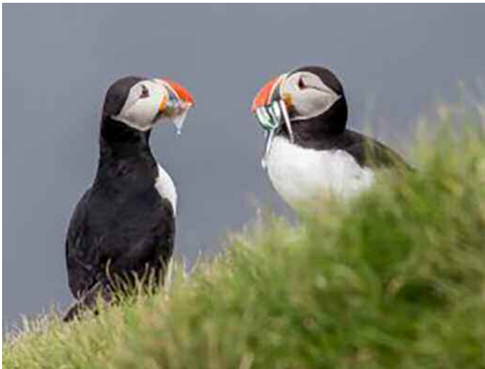
Søpappegøjer på Island.