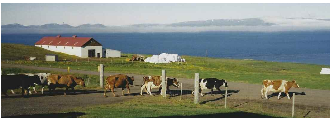
Køer på Island.

K. Torben Rasmussen blev i 1997 hædret med Ridder af Den Islandske Falkeorden.