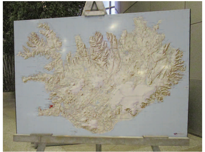
Kort over Island. Foto: Troels Jensen.