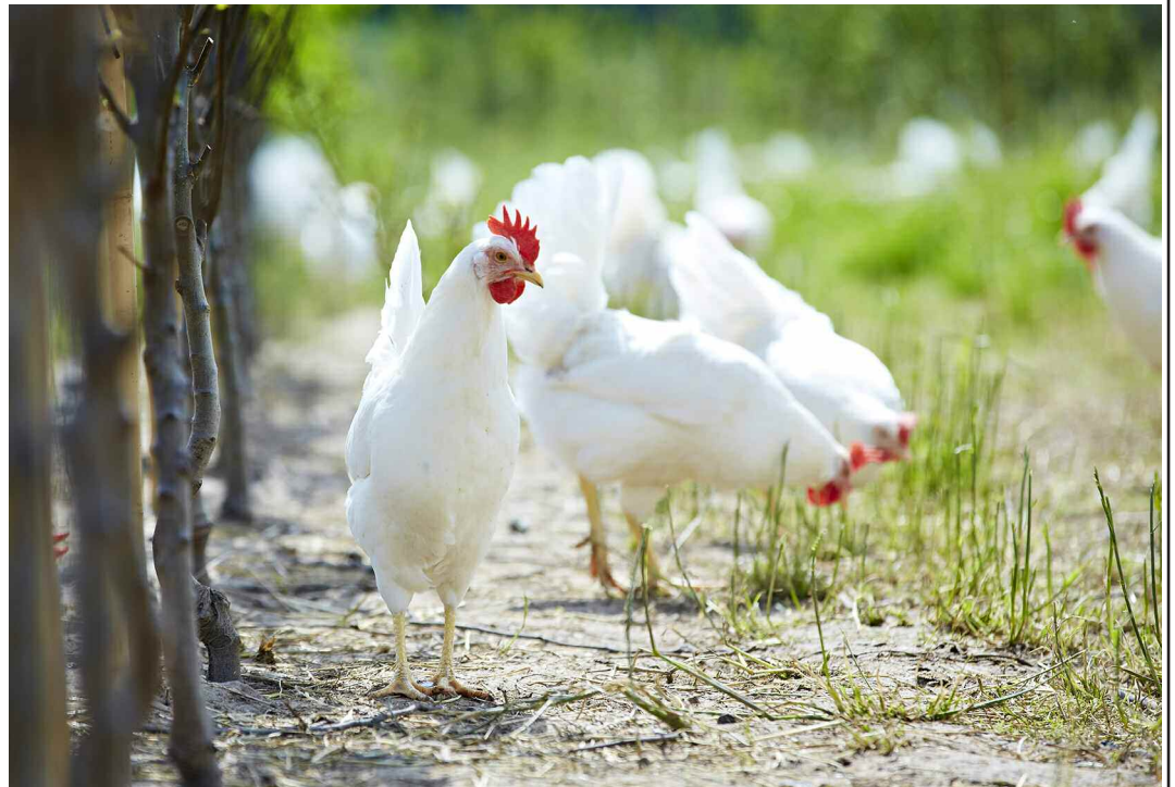
Økologiske høns på græs.

DAVA Foods er markedsleder i de nordiske lande, hvor koncernen sælger hvert tredje æg - to milliarder æg om året.